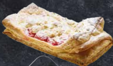
FEUILLETÉ CERISE STREUSEL