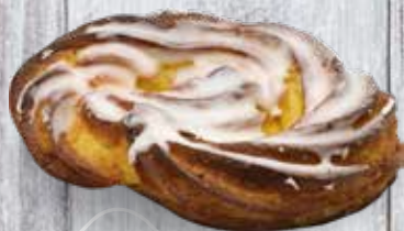
BRETZEL PÂTE À CHOUX