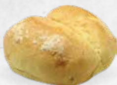
PAIN AU LAIT