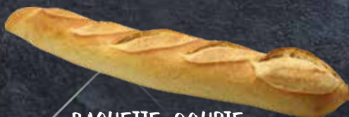
BAGUETTE COURTE 250g