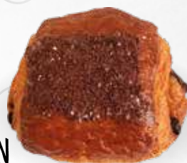
PAIN CHOCO PÉPITES