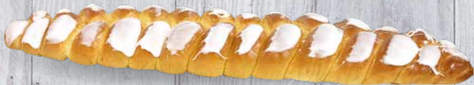
GRANDE OU PETITE TRESSE