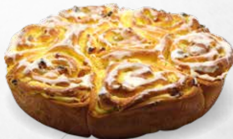
GRAND CHINOIS RAISIN