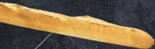
BAGUETTE LONGUE 250g