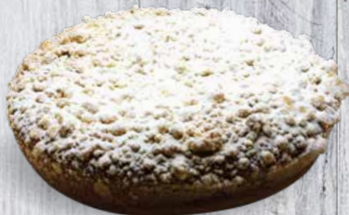
GRAND OU PETIT STREUSEL