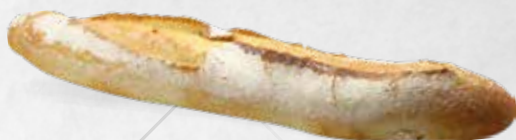
BAGUETTE DU PATRON 250g