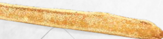
BAGUETTE SÉSAME 250g