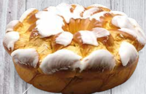
GRAND, MOYEN OU PETIT KRANZ