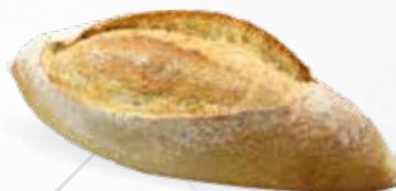
PETITE FESTIVALE 125g