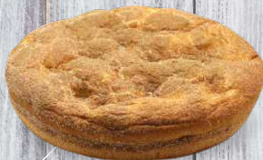
GRAND OU PETIT ZIMETT