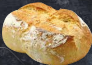
PETIT PAIN DOUBLE