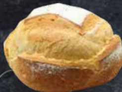
PAIN ROND BLANC 400g