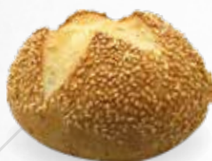
PETIT PAIN SÉSAME 80g