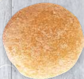
BEIGNET ROND CONFITURE*