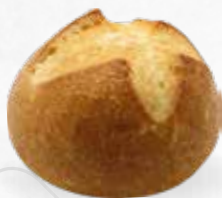
PETIT PAIN NATURE 80g