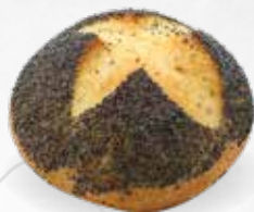
PETIT PAIN PAVOT 80g