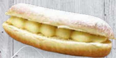
BEIGNET CRÈME PÂTISSIÈRE