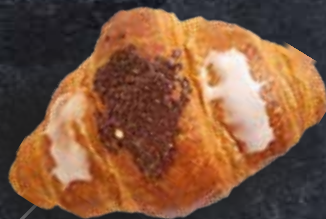
CROISSANT CHOCOLAT BEURRE